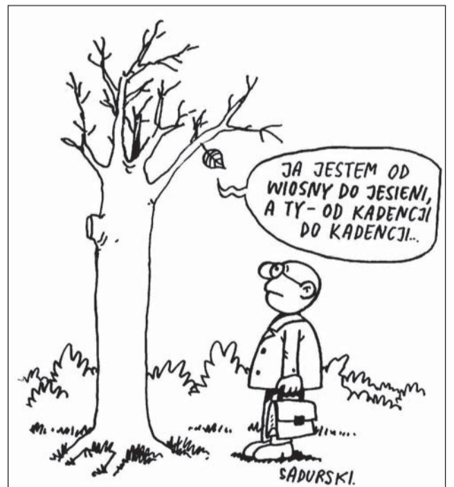
RYS. – SZCZEPAN SADURSKI

Nie może także zdradzać swoich preferencji politycznych. Obserwując wybory, należy zachowywać równy dystans do wszystkich komitetów zaangażowanych w proces wyborczy i ujawniać nieprawidłowości, niezależnie od tego, z której strony one pochodzą. (na)