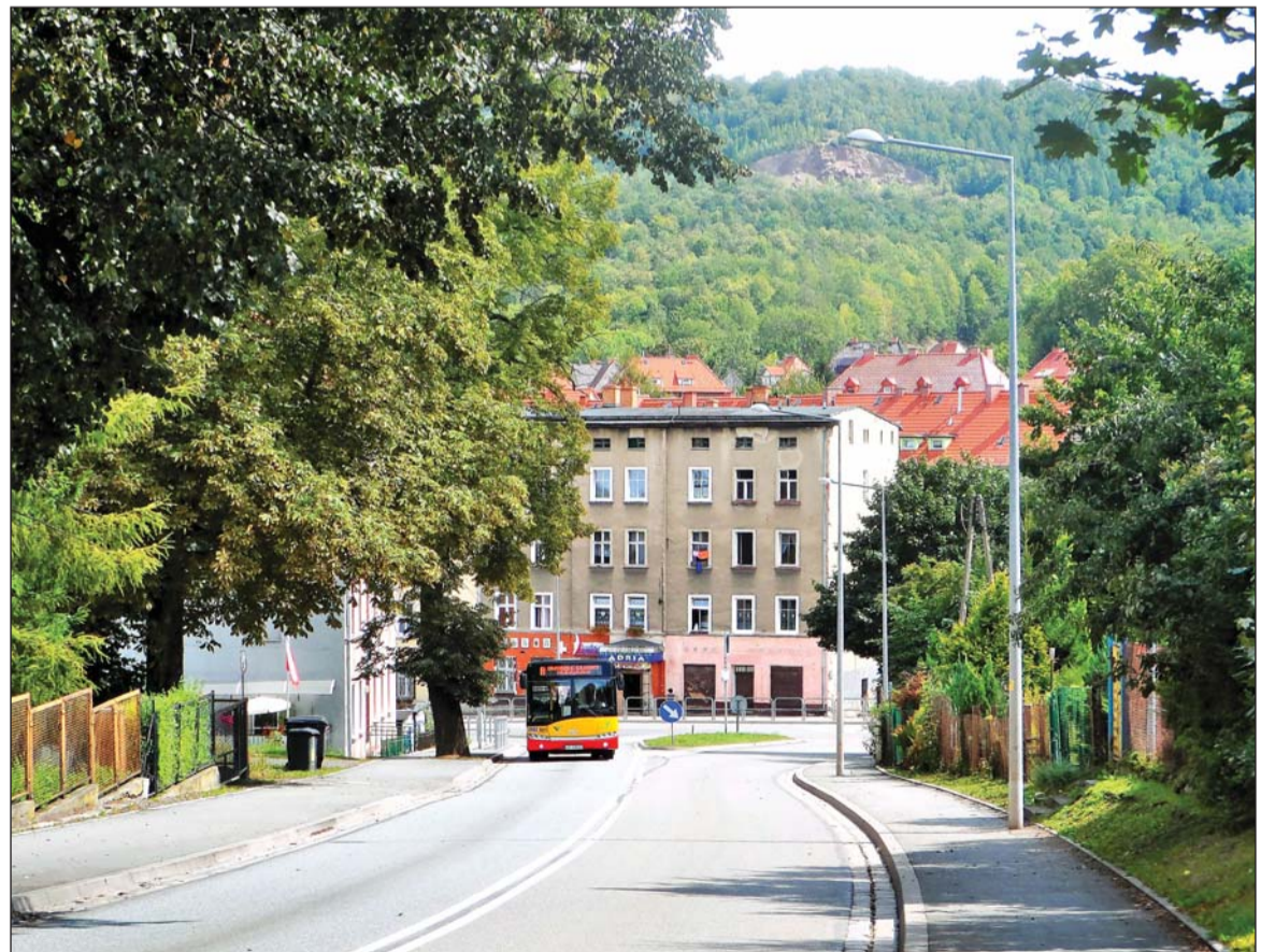
Ostatni odcinek ulicy Gdyńskiej. W widoczny w głębi budynek w grudniu 1945 roku wpadł rozpedzony tramwaj jadący z Dworca Głównego na plac Grunwaldzki.

Piętnaście lat później z ulic Wałbrzycha zniknął ostatni tramwaj.