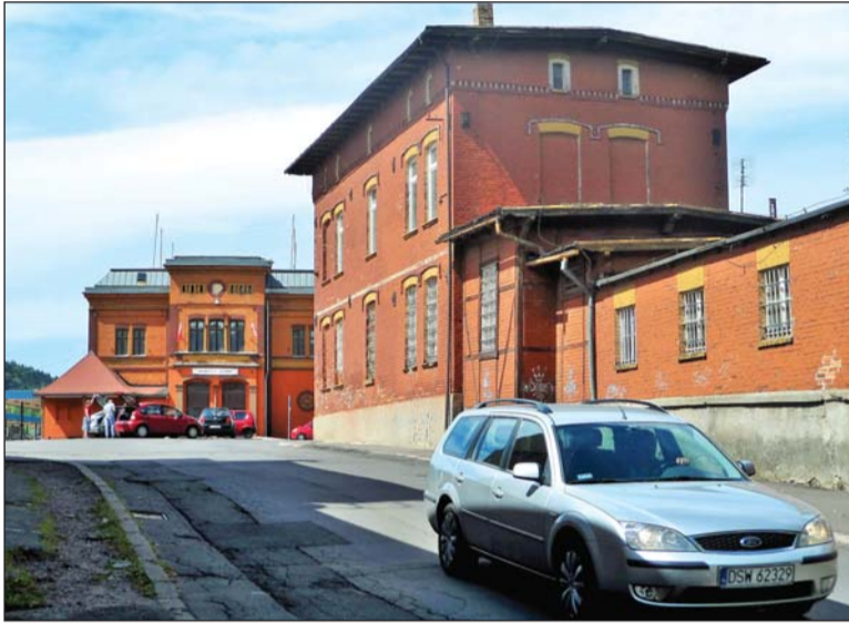
Początek zjazdu ulicą Gdyńską z Dworca Głównego w Wałbrzychu w kierunku ulicy Niepodległości.