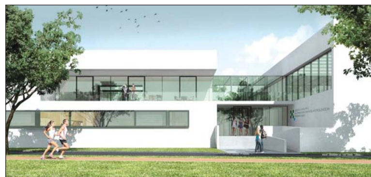
Wizualizacja Centrum Kształcenia Praktycznego w Swarzędzu

Wśród inwestycji zakończonych w 2016 r. znajdują się również: przebudowa poddasza budynku Zespołu Szkół w Kórniku, przystosowanie pomieszczeń budynku „Jacek” przy Domu Dziecka w Kórniku-Bnieniu na potrzeby poradni psychologicznej – pedagogicznej, wykonanie instalacji chłodzenia trzech pomieszczeń Ośrodka Interwencji Kryzysowej w Kobylnicy oraz zagospodarowanie jego terenu.