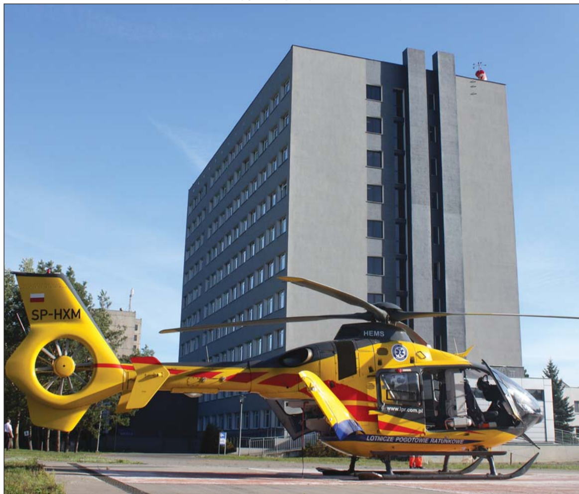
Szpital w Puszczykowie im. prof. S. T. Dąbrowskiego

W minionym roku Powiat Poznański przeznaczył 8,6 mln zł na przedsięwzięcie pod nazwą „Rozbudowa Szpitala w Puszczykowie im. Prof. S. T. Dąbrowskiego SA o budynek bloku operacyjnego wraz z budową szybu windowego”. Ze środków, które szpital otrzymał rok wcześniej w ramach podwyższenia kapitału zakładowego, wydano ponad 1,5 mln zł, przeznaczając je m.in. na: zakup sprzętu medycznego oraz wyposażenie oddziału kardiologii i oddziału okulistyki. Remonty i inwestycje objęły modernizację I i IX piętra budynku szpitala, remonty i adaptacje innych budynków i pomieszczeń, a także modernizację wentylacji mechanicznej.