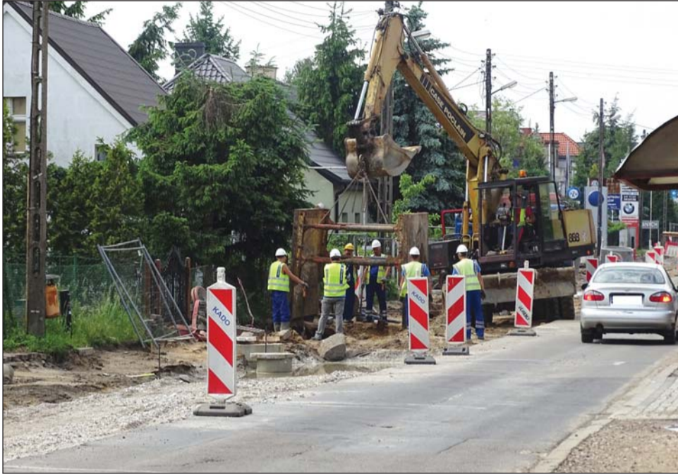
Budowa kanalizacji, ul. Grunwaldzka w Plewiskach

Zdając sobie sprawę, że sprawny transport jest jednym z elementów, które wpływają na jakość życia w regionie i gwarantują jego zrównoważony rozwój, władze powiatu sporo inwestują w infrastrukturę drogową.