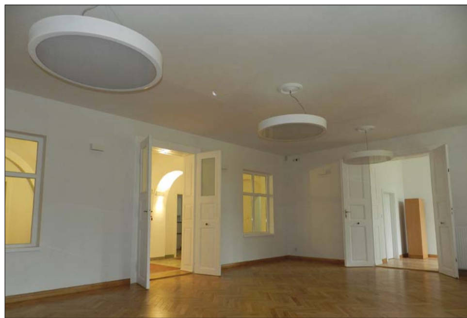
Zespół Szkół im. Jadwigi i Władysława Zamoyskich w Rokietnicy

W swarzędzkiej placówce miała miejsce inauguracja roku szkolnego 2016/2017, w której, na zaproszenie Jana Grabkowskiego, Starosty Poznańskiego, uczestniczyła Teresa Wargocka, sekretarz stanu w Ministerstwie Edukacji Narodowej. Minister miała okazję do zapoznania się z ofertą kształcenia zawodowego m.in. podczas prezentacji modelu edukacji zawodowej realizowanej w systemie dualnym, przygotowanej przez swarzędzką „Jedynkę”.