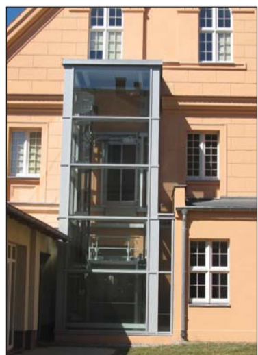
Winda zewnętrzna dla dzieci niepełnosprawnych ruchowo w Specjalnym Ośrodku Szkolno-Wychowawczym dla Dzieci Niewidomych w Owińskakach

Powiat Poznański sporo inwestuje również w materialną bazę podlegających mu placówek edukacyjnych i wychowawczych. Jednym z najambitniejszych projektów jest budowa Centrum Kształcenia Praktycznego przy Zespole Szkół nr 1 im. Powstańców Wielkopolskich w Swarzędzu. W roku 2015 rozstrzygnięto konkurs na koncepcję architektoniczno-urbanistyczną, a w roku ubiegłym zrealizowano koncepcję wielobranżową, projekt budowlany i projekty wykonawcze.