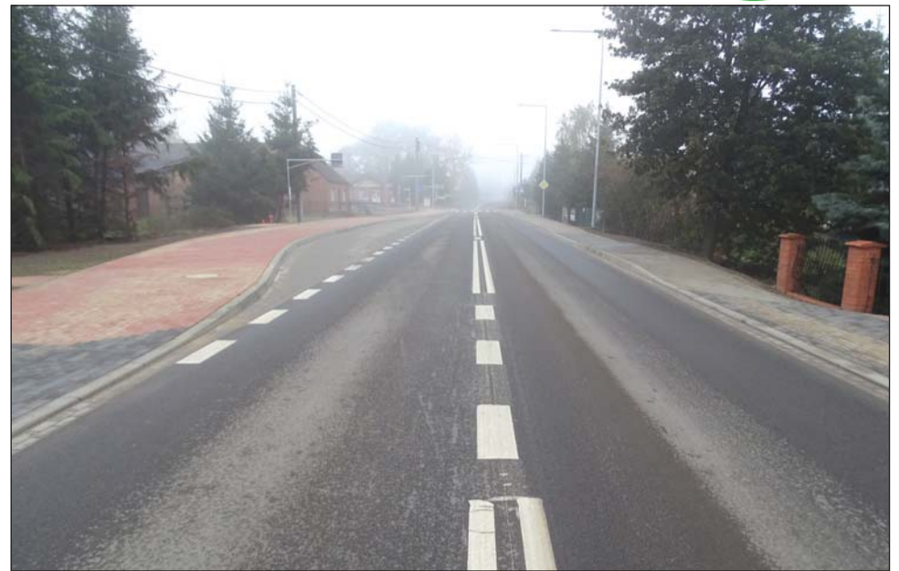
ul. Kierska po odbiorze październik 2016