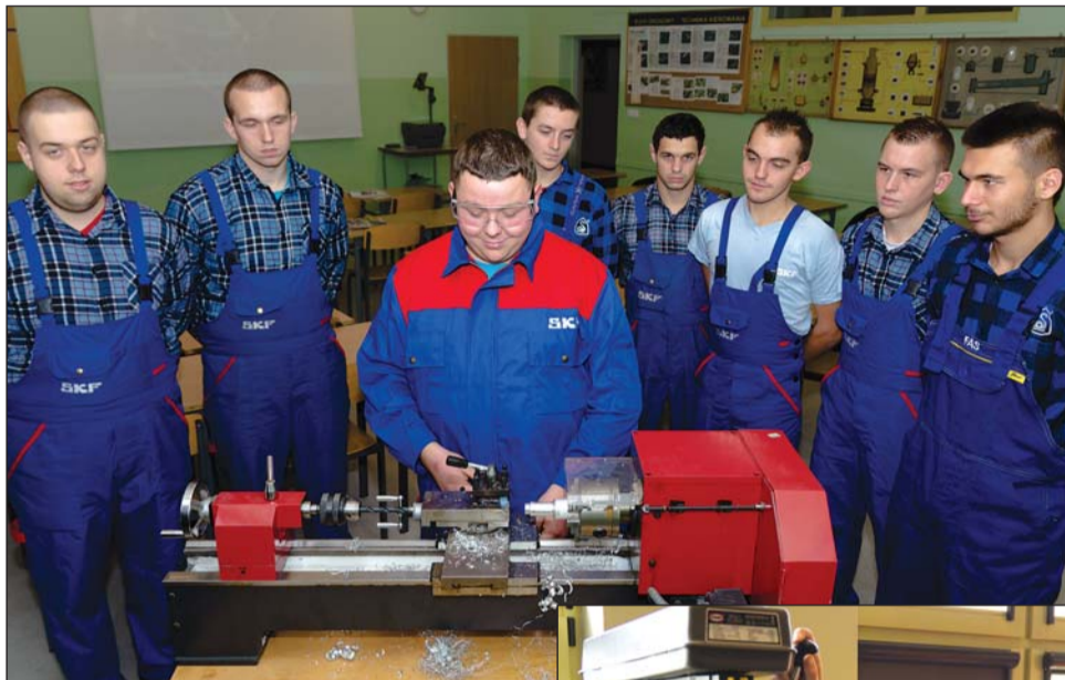
Zespół Szkół nr 1 w Swarzędzu

W placówkach edukacyjnych zarządzanych przez Powiat Poznański od dawna realizowana jest polityka oświatowa, zgodna z wizją budowania wszechstronnej i stabilnej oświaty, reagującej na potrzeby rynku pracy. Powiat Poznański od ponad dziesięciu lat stawia na szkolnictwo zawodowe.